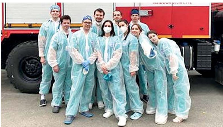
Команда Курского ГМУ

Подготовил Владимир КОРОЛЁВ, соб. корр. «МГ».